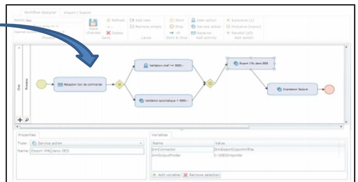
Figure 1: Sa concrétisation avec notre solution